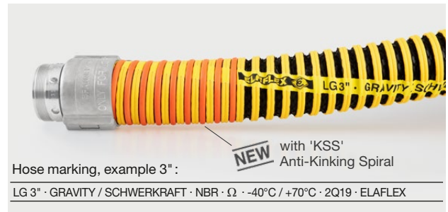
Hose marking, example 3" :

LG 3" · GRAVITY / SCHWERKRAFT · NBR · Ω · -40°C / +70°C · 2Q19 · ELAFLEX